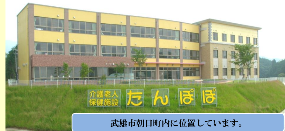
武雄市朝日町内に位置しています。